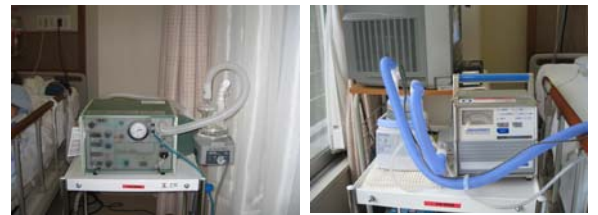
フジレスピトロニクス PLV100