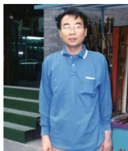
中国での治療の日々