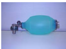
アンビュウバッグ