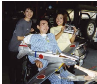
外泊中おもちゃ一杯のガレージで(学生ボランティアと)

実家にいるときは家族が夜中も誰かがおきていてくれています。病院にいるときは、夜は病院の皆様面倒をみていただいているので、家族も安心して夜は自分の時間を過ごしているようです。